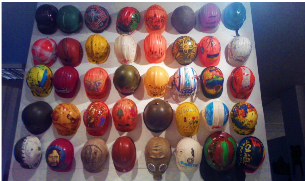
Таких касок під час Революції Гідності на Майдані було тисячі