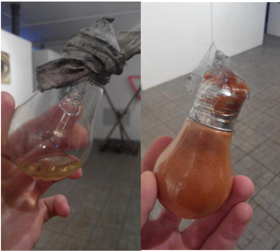
Це лампочки які були наповнені перцем, і які кидали під час наступу Беркуту. Тільки щоб засліпити, не травмувати