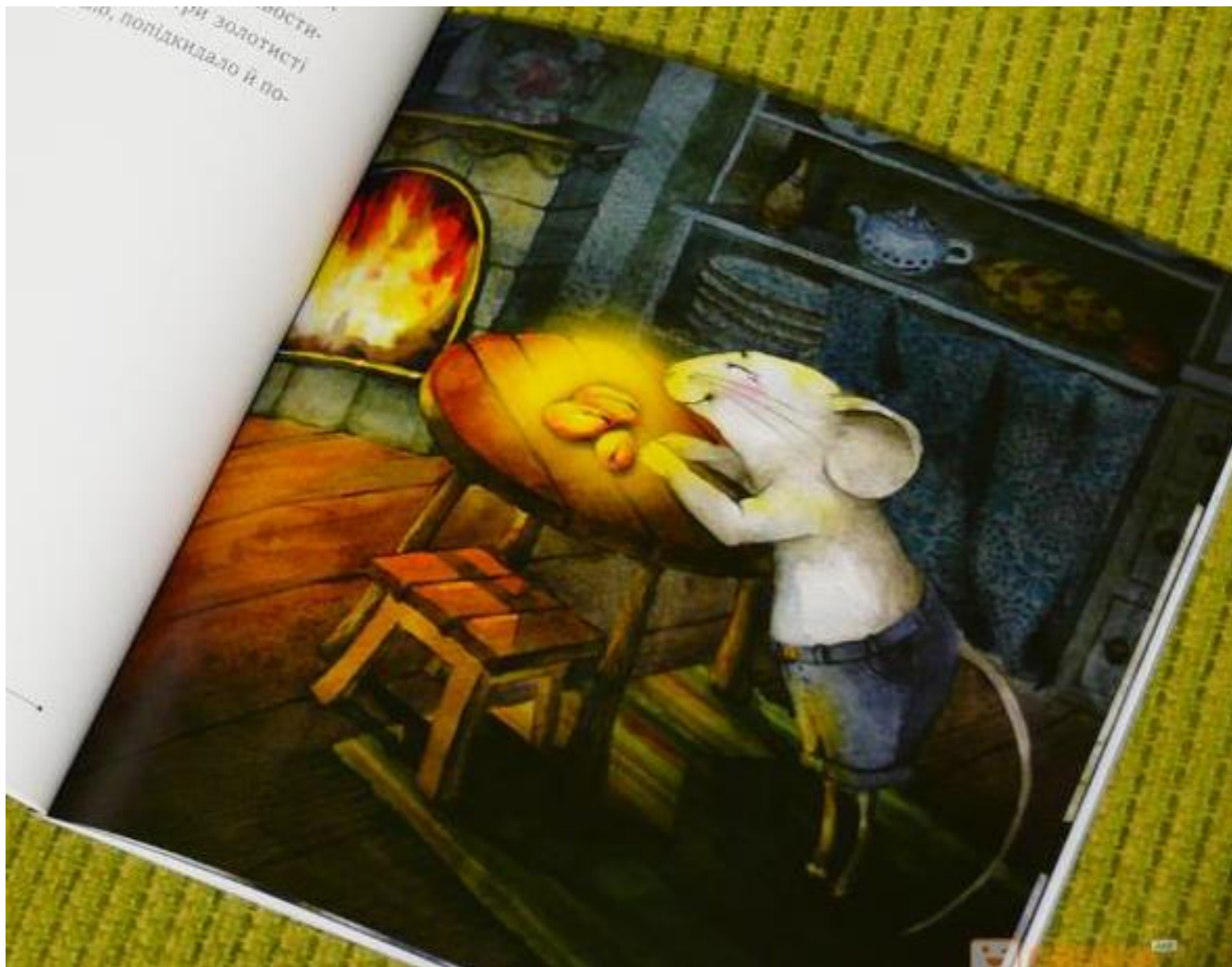
Ілюстрація Вікторії Кириченко, видавництво БРАЙТ БУКС