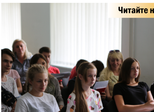
Школа майбутнього – це школа гармонійного розвитку