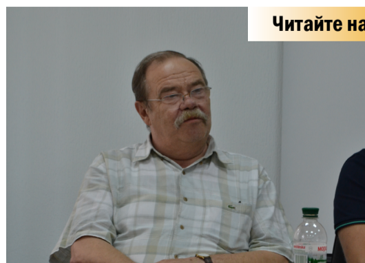
Володимир Мостовий – явище в українській журналістиці