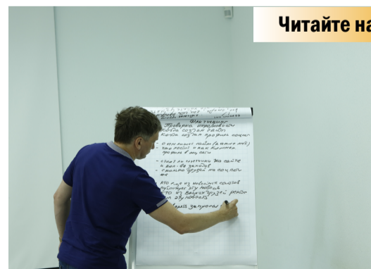
Про медіаграмотність і фактчекінг для журналістів-початківців